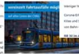
vereinzelt Fahrtausfälle möglich auf einer Strecke bei COVID

auch die Corona-Pandemie nicht spüren an am vorbei. Die dadurch entstehenden Ausfälle können wir leider nicht immer kompensieren. Wir bitten um Ihr Verständnis.