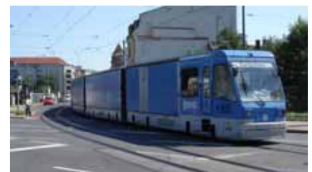
Die Cargotram in Dresden (2001 bis 2020)

Im Modell „Beiladung“ sind nach heutigem Stand zum Beispiel Gefahrgüter de facto nicht darstellbar. Für bezuschusste Unternehmen der öffentlichen Hand gilt außerdem, dass sie der Privatwirtschaft keinen unfairen Wettbewerb machen dürfen, indem sie zum Beispiel ihre Transportpreise für Güter unter Ausklammerung von „Sowieso-Kosten“ kalkulieren. thr